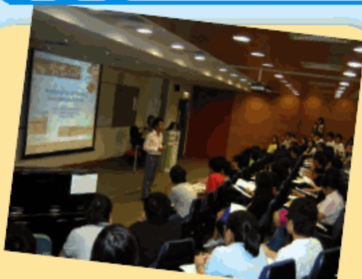
健康講座於香港浸會大學 國際學院健康與食品科學系 由 HK BioTek 健康教育組主講