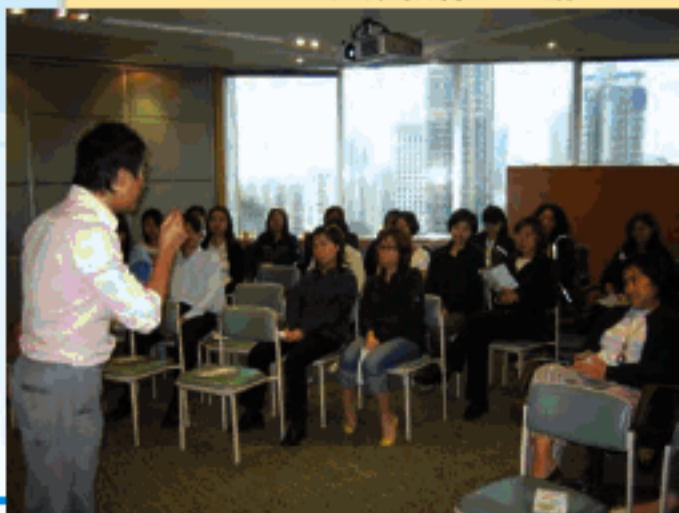
健康講座於英國石油公司 由 HK BioTek 健康教育組主講

為了推動關愛健康的訊息，我們的健康教育組大使聯同客席醫生團隊都會定期與不同企業，教育及健康團體合辦健康講座，提供多元化和與生活息息相關的健康資訊。透過互動性的交流及現場問答環節，相信參加者也能更明白健康的重要，健康教育組大使將來會繼續努力為大家健康加油！