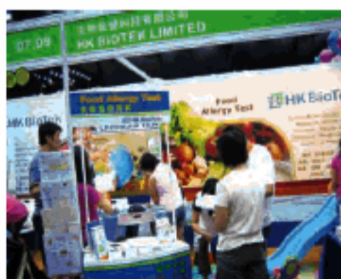
不少家長於HK BioTek的攤位索取健康資訊