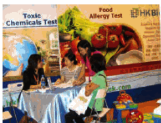
營養顧問即場提供免費的營養建議