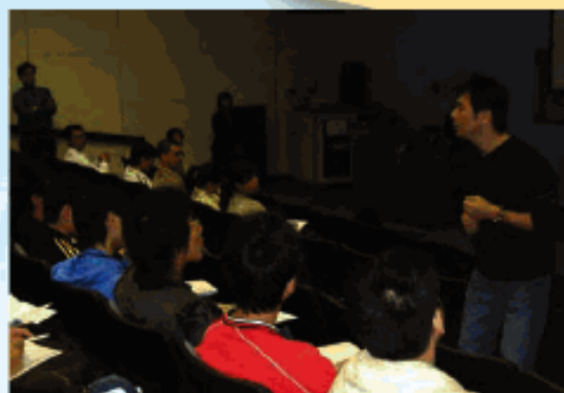
健康講座於香港專業教育學院應用科學系 由 HK BioTek 健康教育組主講